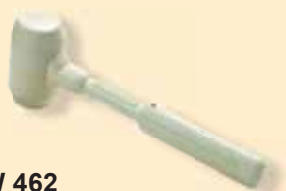
TKW 462 Martello di gomma bianca