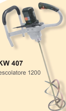
TKW 407 Mescolatore 1200