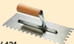
TKW 121 Spatola 10x10 mm