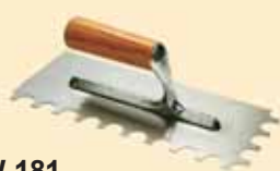
TKW 181 Spatola tonda Ø 15 mm