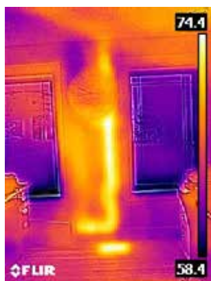
Tubo di scarico caldo nella parete