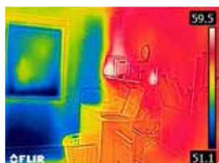
Parete esterna non isolata