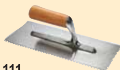
TKW 111 Spatola 8x8 mm