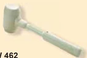
TKW 462 Martello di gomma bianca