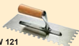
TKW 121 Spatola 10x10 mm