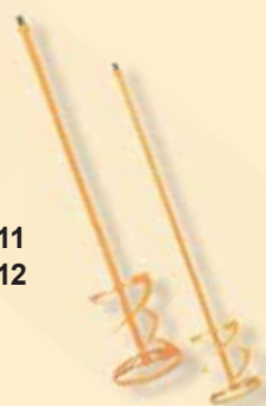
TKW 411 TKW 412