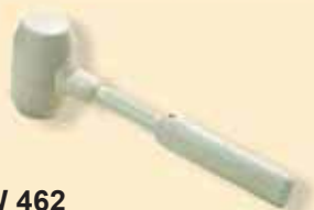
TKW 462 Martello di gomma bianca