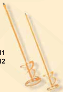
TKW 411 TKW 412