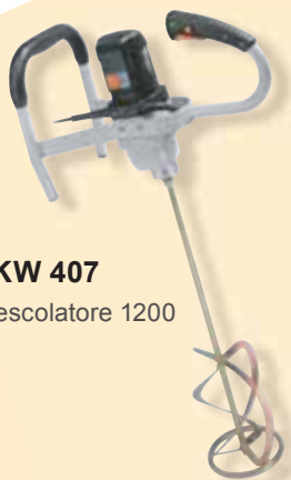
TKW 407 Mescolatore 1200