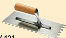
TKW 121 Spatola 10x10 mm