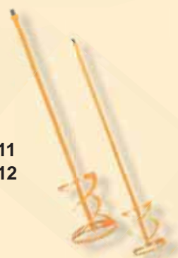
TKW 411 TKW 412