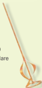
TKW 410 Asta Circolare