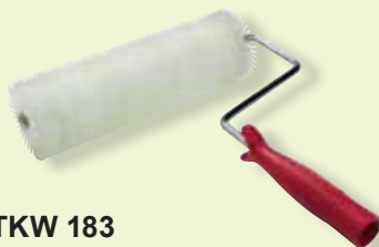
TKW 183 Rullo frangibolle