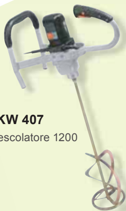
TKW 407 Mescolatore 1200