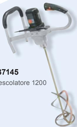
437145 Mescolatore 1200