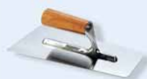
437187 Spatola liscia 28x12 cm