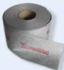
437337 Bandella RL 120